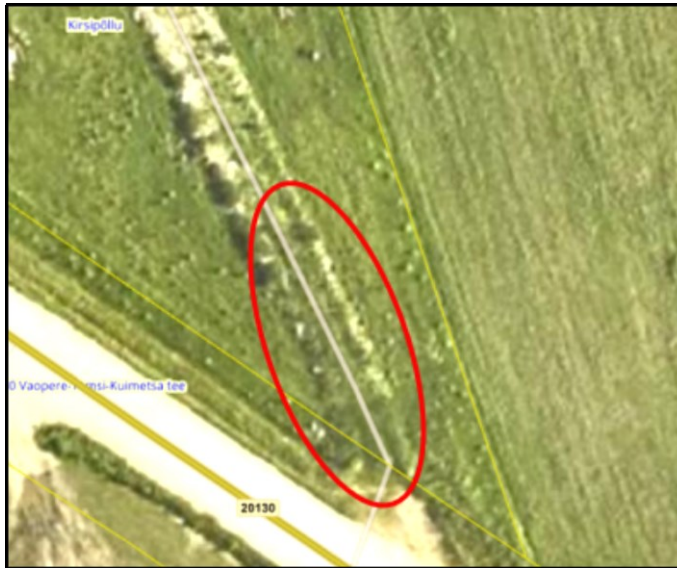
Väljavõte Maa- ja Ruumiameti aerofotost

Arvestades eeltoodut nõustume lahendusega, mille kohaselt nimetatud ristumiskoht jäetakse kasutusest välja ning seda edaspidi ei kasutata.