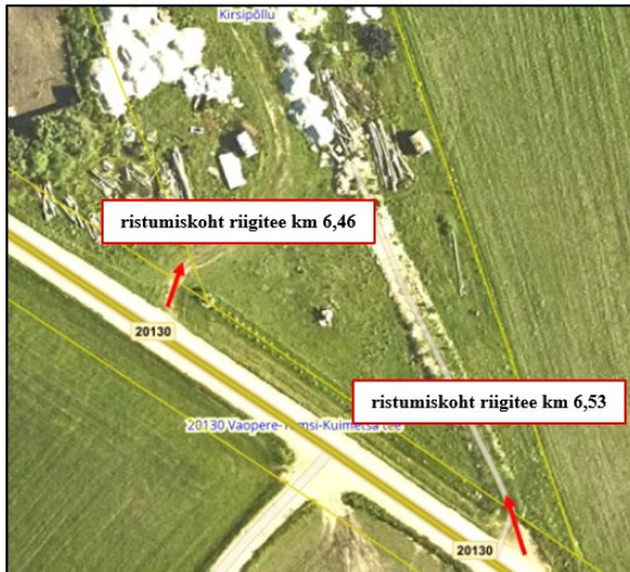
Väljavõte Maa- ja Ruumiameti teeregistrist

Oleme hinnanud olemasolevate ristumiskohtade sobivust ning meie hinnangul on kinnistule juurdepääsu tagamiseks sobiv lahendus riigitee km 6,46 olemasoleva ristumiskoha kasutamine.