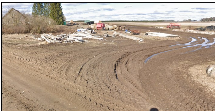
Väljavõtted Maa- ja Ruumiameti kaldaerofotost (aastal 2025) ja teevideost (aastal 2023)